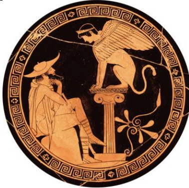
Ödipus und die Sphinx