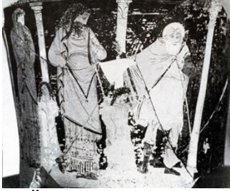
Ödipus und Tiresias