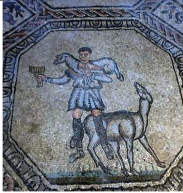
Hirte mit Panflöte