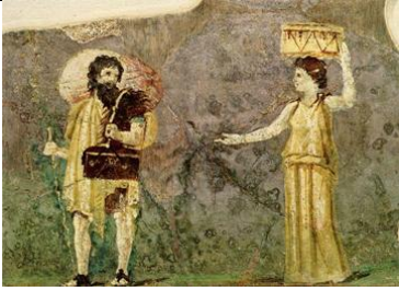
Kater von Theben mit Bürgerin